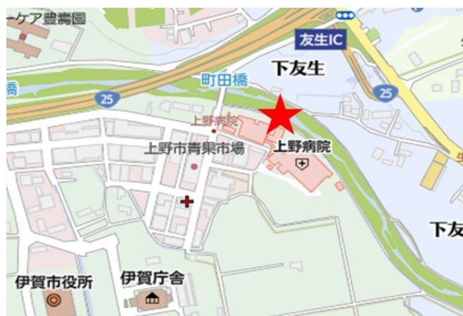
ご来院時の駐車場について